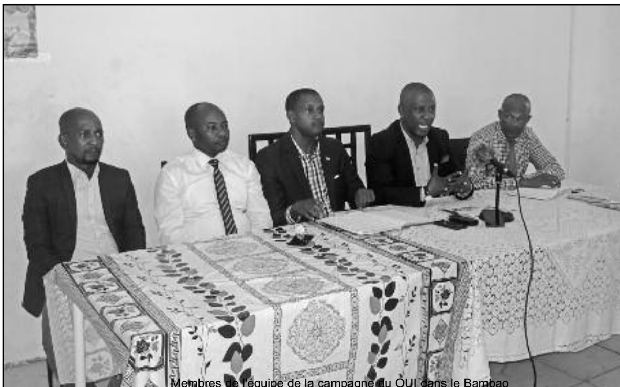
Membres de l'équipe de la campagne du OUI dans le Bambao